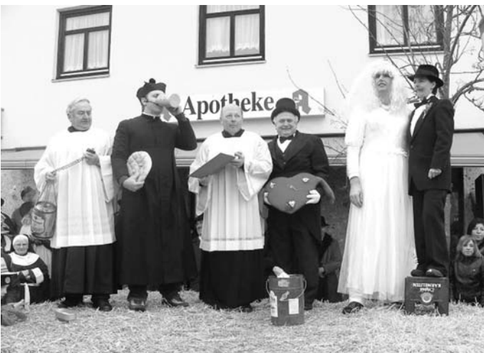
Das frisch getraute Paar, kurz nach der Trauung.