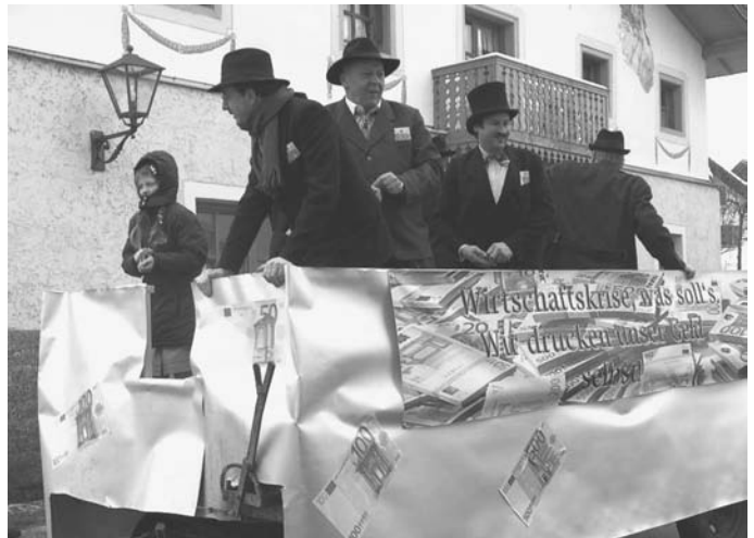
Die Gemeinde Stallwang entledigt sich ihrer Finanznot, indem sie jetzt ihr Geld nicht mehr von der Bank holt, sondern selber druckt.