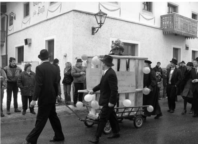
Selbstverständlich konnte die böse Schwiegermutter nur in Käfighaltung an der Hochzeit teilnehmen.