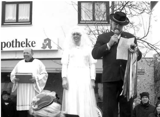
Eine der wichtigsten Personen, wie bei jeder Hochzeit, war auch hierbei der Hochzeitslader.

Die Faschingshochzeit am Faschingssonntag in Stallwang war eine gelungene Sache. Die Vereine aus Stallwang und Landorf haben Sehenswertes auf die Beine gestellt. Nachstehend einige Schnappschüsse aus dieser Veranstaltung.