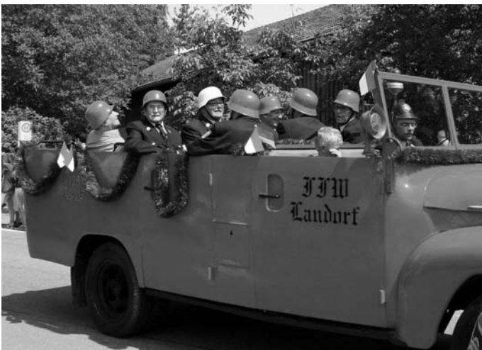
Altgediente Feuerwehrkameraden nahmen im historischen Feuerwehrauto von anno dazumal am Festumzug teil.