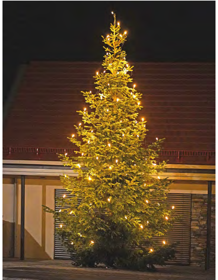
Weihnachtsbaum in Wetzelsberg