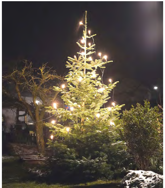
Weihnachtsbaum in Schönstein