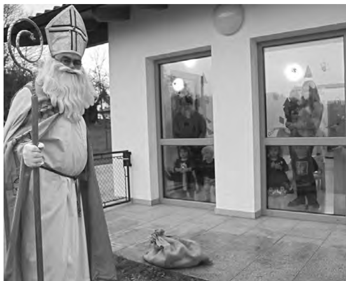
Bild: Die Krippenkinder staunten über den Besuch des heiligen Nikolaus

..... besuchte auch dieses Jahr die Kinder in der Kindertagesstätte. Ganz aufgeregt war die Kleinkindgruppe, als er an ihrem Fenster vorbeimarschierte. Als er dann auch noch stehen blieb, ihnen zuwinkte und einen Sack mit Geschenke abstellte war die Freude groß. Die Kindergartenkinder der blauen und grünen Gruppe erwarteten den heiligen Mann dann im Garten. Sie sangen ihm Lieder und sagten Gedichte. Auch hier ließ er für jede Gruppe einen Sack mit Geschenke stehen, die die Erzieherinnen im Anschluss an die Kinder austeilen konnten. Erwartungsvoll standen die Krippenkinder schon am Fenster und warteten darauf, dass der Nikolaus den Berg hinaufgeht und sie ihn endlich sehen konnten. Durch das Fenster winkten sie ihm zu und freuten sich über den Sack mit Geschenke!