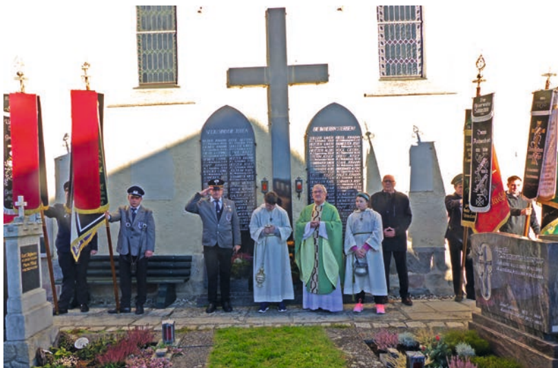
Totengedenken am Kriegerdenkmal in Wetzelsberg.