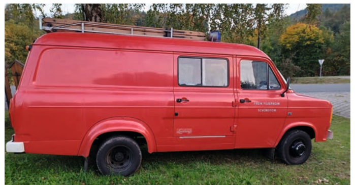
1974 erstes gebrauchtes Feuerwehrfahrzeug Marke Ford

Ein neues modernes Feuerwehrfahrzeug der Marke Mercedes Sprinter TSF wurde am 11.10 2022 geliefert.