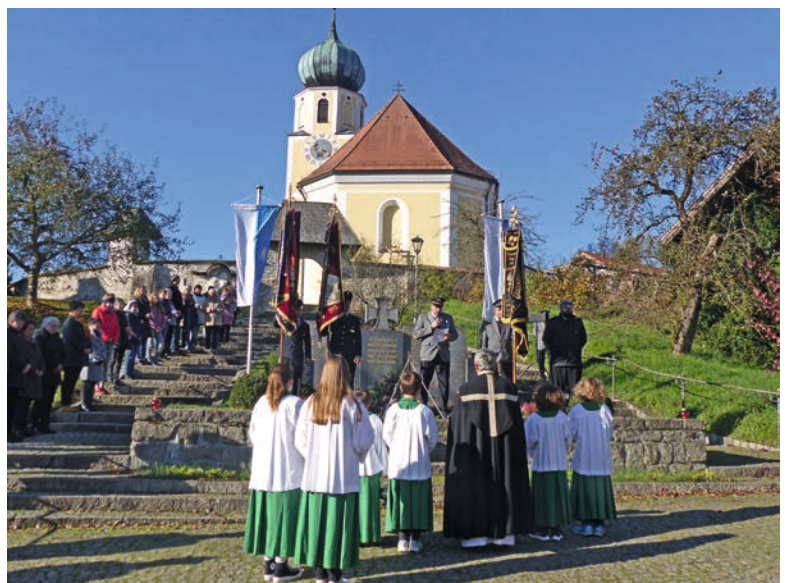
Totengedenken in Stallwang am Denkmal.