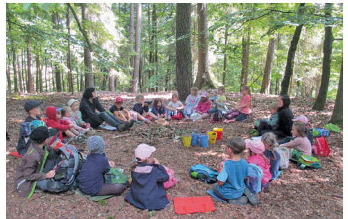
Bild: Bei Ankunft im Wald wird erstmal Brotzeit gemacht und werden die Regeln besprochen.