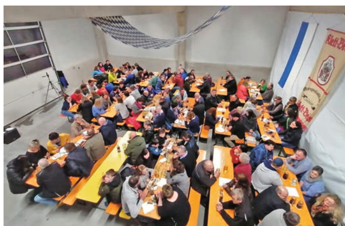
Ein Teil der Besucher der Veranstaltung