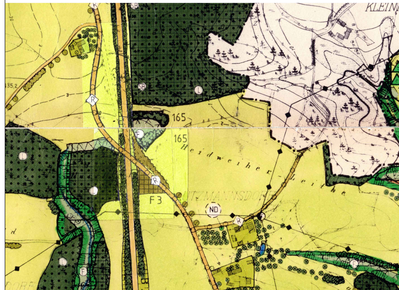
DECKBLATT NR. 6 ZUM FNP / LP